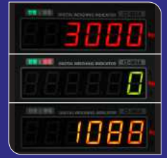
3색 LED 디스플레이 (적색, 녹색, 황색)