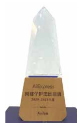
2020 年 AliExpress 美容个护杰出品牌