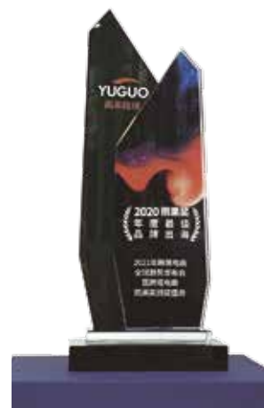
2020 年雨果跨境年度最佳出海品牌