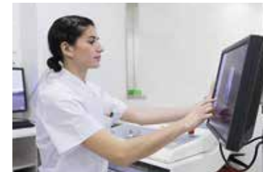
ANLAN仓库具有先进的监管系统