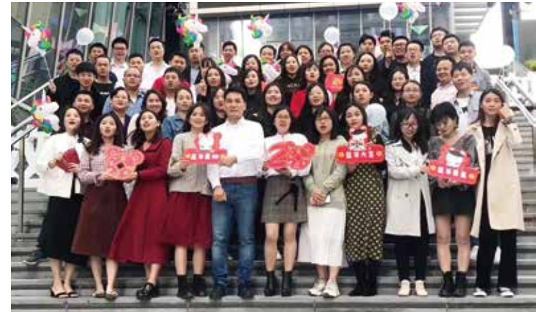
团队壮大、ANLAN 从未停止进步