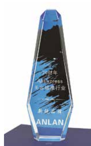
2020 年 AliExpress 美容健康行业新锐品牌